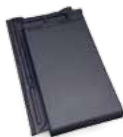
Bergamo antracytowa angobowana

min. wartość obliczeniowa szt./m 2 : .....12 szt./m 2 : .....11,8–12,8 szt./paleta: .....240 waga 1 szt.: .....ok. 3,95 kg