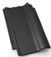
Piemont antracytowa angobowana

min. wartość obliczeniowa szt./m 2 : .....10,1 szt./m 2 : .....ok. 10,6 szt./paleta: .....240 waga 1 szt.: .....ok. 3,8 kg