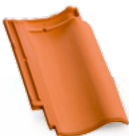
Bornholm czerwona natura

min. wartość obliczeniowa szt./m 2 : .....12,2 szt./m 2 : .....ok. 12,5 szt./paleta: .....240 waga 1 szt.: .....ok. 3,8 kg